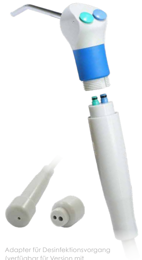
Adapter für Desinfektionsvorgang (verfügbar für Version mit dem abnehmbaren Spritzekopf)

! Hülsen erhältlich für diverse Köchergrößen. (Bitte geben Sie uns an, welche Spritze vorher im Köcher verwendet wurde)!